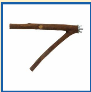
Poleiro de madeira

Comedores e bebedouros devem ser de cerâmica ou inox já que estes materiais não acumulam bactérias com facilidade, ao contrário do plástico, que pode riscar e reter sujeira. Além disso, são fáceis de limpar, não liberam substâncias tóxicas para o seu pet e são mais resistentes ao tempo de uso, às mordidas e às lavagens frequentes. No caso dos bebedouros sempre devem estar posicionadas no alto e nunca abaixo dos poleiros.