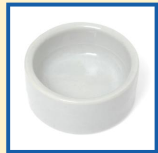
Comedouro/Bebedouro de cerâmica