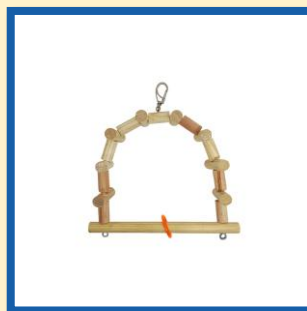
Mini balanço de madeira